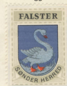
Falsters Sønder Herred

Sytofte, Idestrup, Vegerløse, Skelby, Gedesby, Sønder-Kirkeby, Sønder-Alslev, Karleby, Horreby, Nørre-Ørslev, Horbelev, Falkerslev, Aastrup.